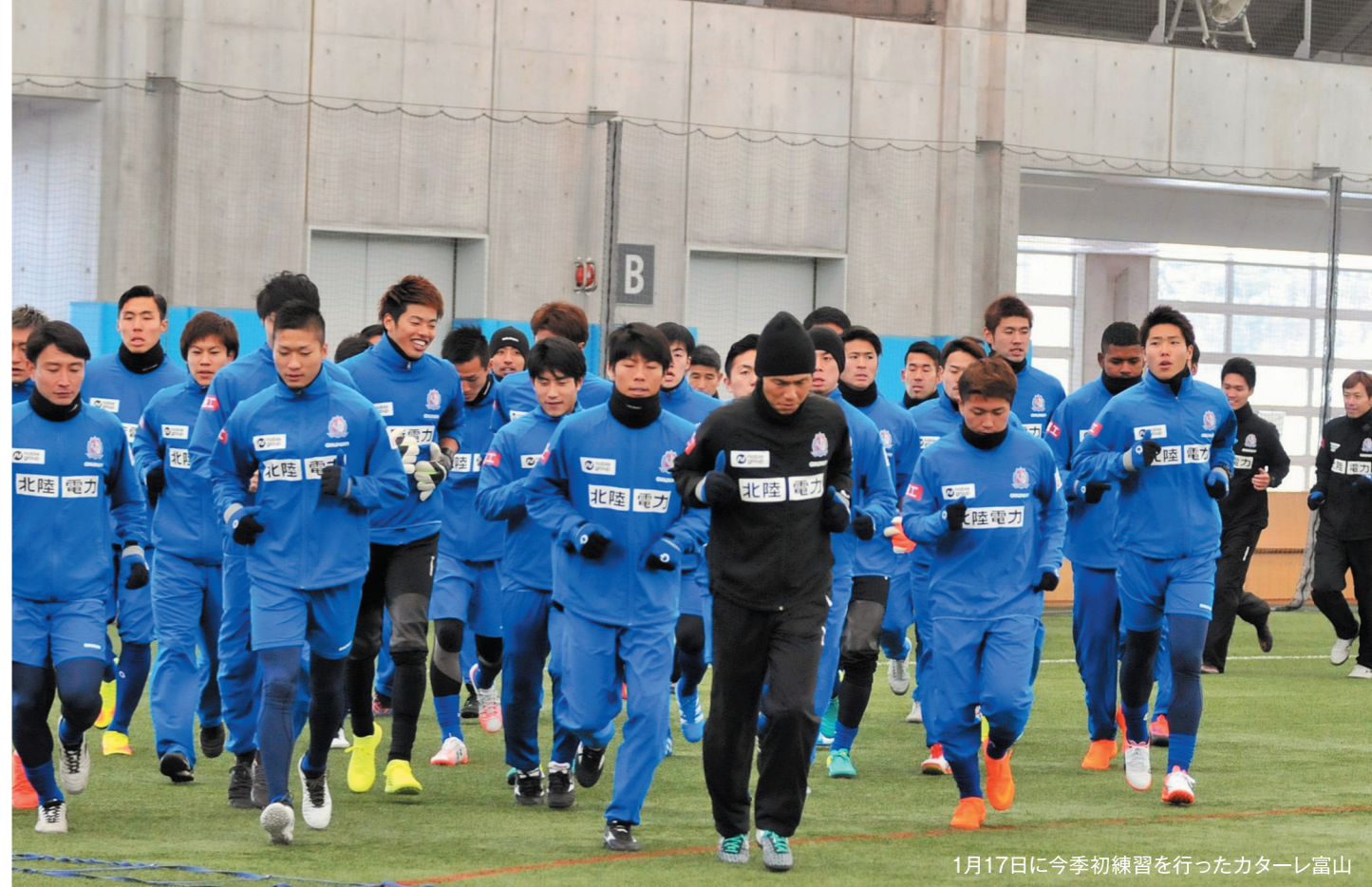
1月17日に今季初練習を行ったカタールレ富山

カタールレ富山はJ3降格後2年目の昨季も目標だったJ2復帰を果たせなかった。2017年は新監督に浮気哲郎氏を迎えて3度目の正直を目指す。