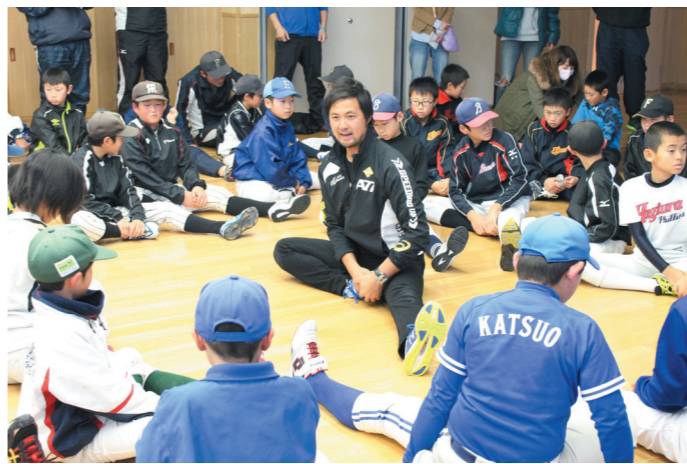
富山少年野球リーグ × Probody